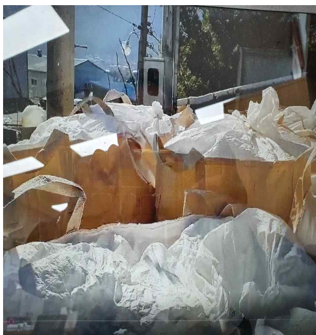
비식품첨가물 규산마그네슘 포장지 해체 (네덜란드산→중국→우리나라 수입)