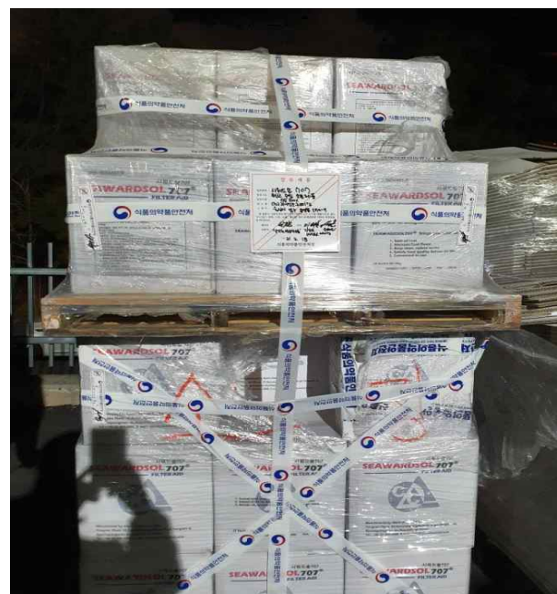
비식품첨가물 규산마그네슘을 식품첨가물 및 국내 제조원으로 거짓표시 제품 압류