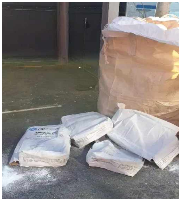
비식품첨가물 규산마그네슘 (Non food additives 표시)