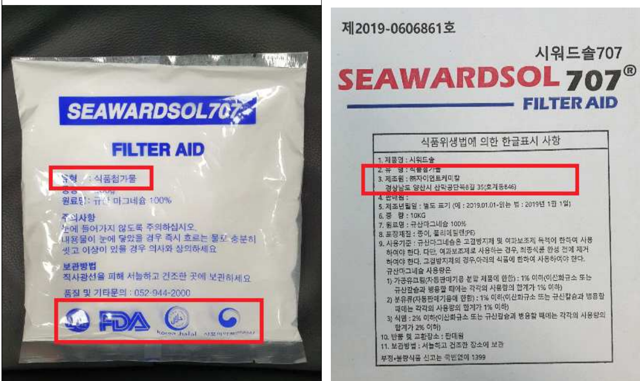
비식품첨가물 규산마그네슘을 제품명 ‘시워드솔’ 식품첨가물(250g)로 소분 포장한 제품 (식품첨가물, 정부인증 거짓 표시)