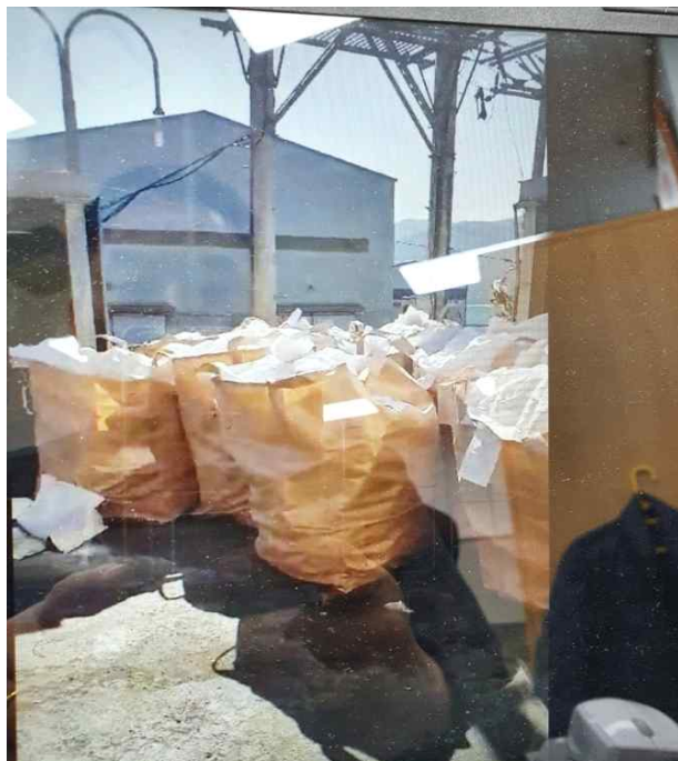
비식품첨가물 규산마그네슘 (네덜란드산→중국→우리나라 수입)