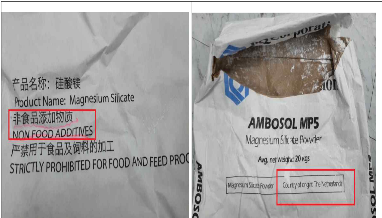
비식품첨가물 규산마그네슘 표시사항 (Non food additives 표시)