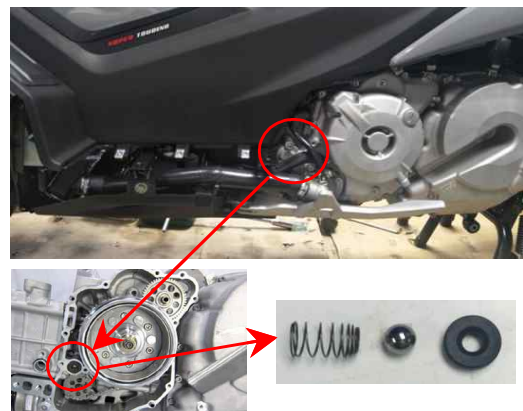
엔진오일 유압조절 장치