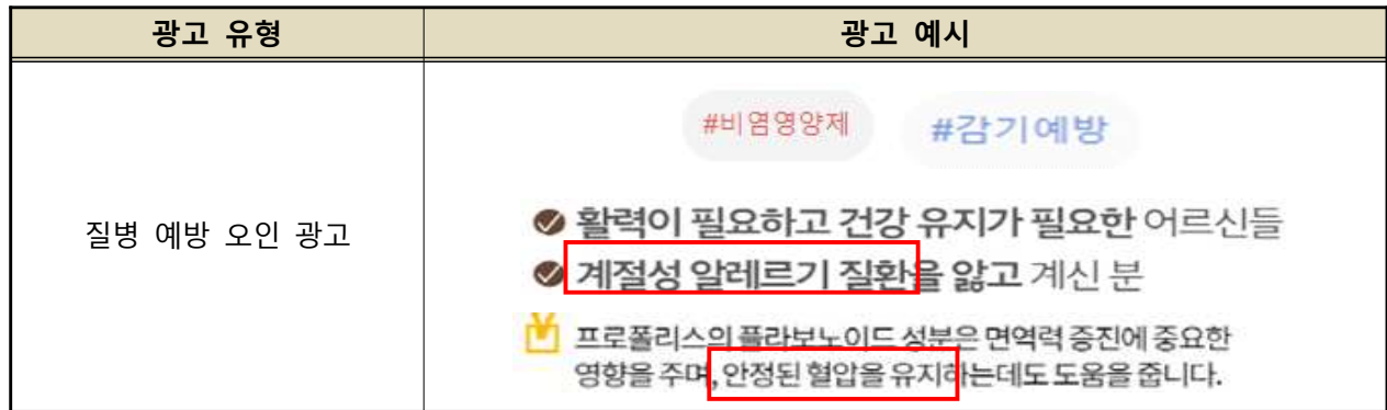
[ 질병 예방 오인 광고 사례 ]