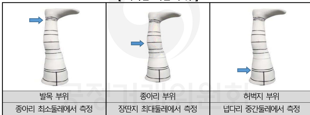
[ 제품별 피복압 강도에 따른 분류 ]