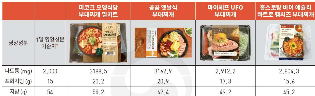
밀키트 1인분의 나트륨, 포화지방 함량이 1일 기준치를 넘는 제품

* 1일 영양성분 기준치 : 「식품등의 표시 광고에 관한 법률 시행규칙」 별표5에 따름